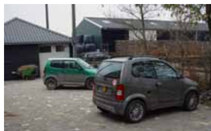
Parkeerplaats bij de koeienstal.

Misschien is het je al opgevallen dat de enorme berg met stenen tussen de hooikap en de glasloods veel kleiner is geworden. Dat komt omdat er naast de koeienstal een parkeerplaats is gemaakt voor 45 km-wagentjes. Er kunnen er vijf staan. Hierdoor is er meer ruimte aan de voorkant voor auto's van bijvoorbeeld bezoekers. Ook de fietsenstalling zal verplaatst worden. Deze komt naast de vuilstraat. Er zijn nog best wat stenen over. Het is de bedoeling om met deze stenen een parkeerplaats tussen het geitenpad en de mestplaat te maken voor de Crafter (grote witte bus). Er is een werkgroep samengesteld die gaat onderzoeken