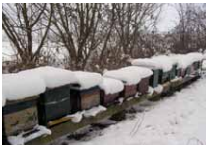
Bijenkasten in de sneeuw

De winter is de rustigste tijd voor de bijen. Zolang de temperatuur niet boven de 10 graden komt, blijven de bijen lekker in hun kast. Ze slapen niet. De temperatuur in de bijenkast is in december ongeveer 15 graden. Ze maken het warm door met hun spieren, waarmee ze normaal hun vleugels bewegen, te trillen, zodat die warmte produceren. Om die warmte zo efficiënt mogelijk te benutten, zitten de bijen dicht bij elkaar in een soort bolvorm. De bijen die aan de buitenkant van die bol zitten, koelen natuurlijk het meest af. Vandaar dat die bijen regelmatig naar het binnenste van de bol gaan en andere bijen komen dan weer aan de buitenkant.