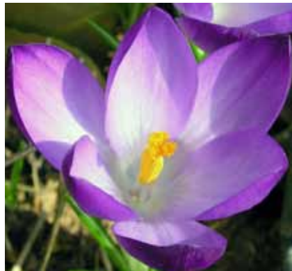
De krokus is, net als het sneeuwkllokje en de gele kornoelje, een vroege stuifmeelleverancier.

anders voor in de plaats komt. Vandaar dat ik ieder bijenvolk in september, als ik de honing er uit gehaald heb, ongeveer 15 kilo suiker geef. Ik doe dit door een hele dikke suiker oplossing (twee kilo suiker opgelost in een liter water) in een bakje te doen zodat