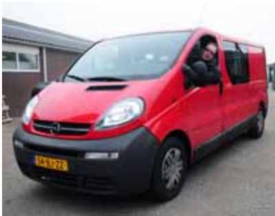
Chauffeur Kees is blij met de nieuwe bus.

De groene Volkswagenbus had in zeven jaar en zeven dagen 344059 km gereden. Dat is meer dan 8x een rondje om de aarde. Geen wonder dat we toe waren aan een nieuwe bus. Het is een Opel Vivaro geworden met zeven zitplaatsen en nog een