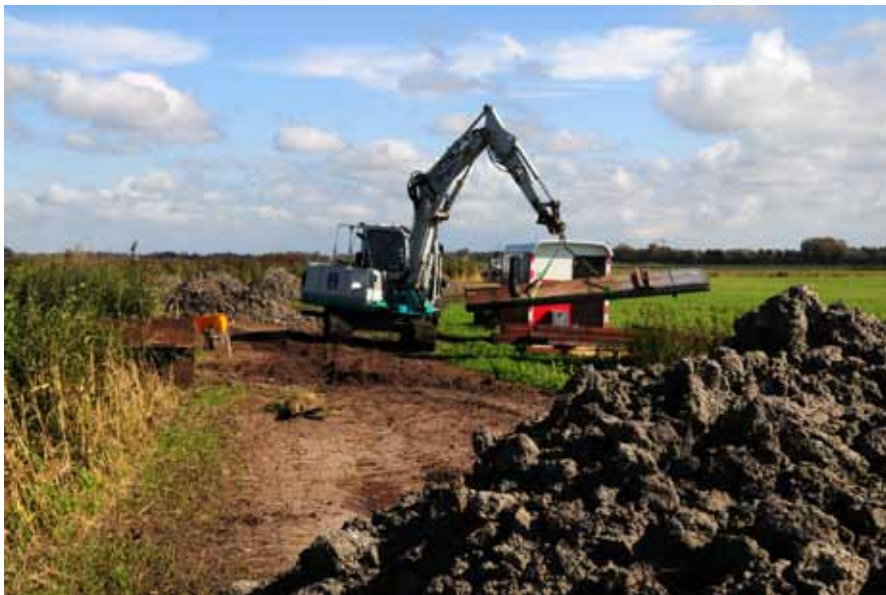
Werkzaamheden bij de waterinlaat.

wat betekent dat alle eigen melk BD blijft en als BD kaas wordt verkocht. Verder zijn we druk bezig om de verouderde kaasmakerij te pimpen, zodat we voor de toekomst nog beter en efficiënter onze producten kunnen blijven maken. Zo, dit was in vogelvlucht een update van het reilen en zeilen binnen de zuivelafdeling, alvast fijne feestdagen.